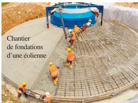
Chantier de fondations d'une éolienne

Au 31 mars 2024, 9 719 éoliennes étaient opérationnelles sur l'ensemble du territoire Français, réparties sur 2 262 parcs, en France, aujourd'hui elles sont environ dix mille, chacune coûtant environ 2 000 000 € fournie, posée. Soit environ 20 milliards d'euros pour le parc. Durée de vie : 20 à 25 ans. Au delà, le décret 2011-985 du 23 août 2011, prévoit le démantèlement jusqu'au ras du sol (coût environ 70 000 euros), mais ce décret occulte la loi 757 du 1er août 2008 qui impose en fait le démantèlement complet (retirer également les pollutions du sol, c'est à dire