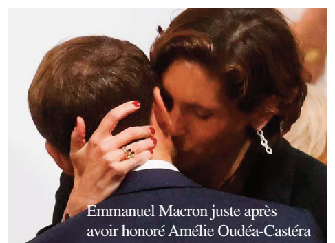
Emmanuel Macron juste après avoir honoré Amélie Oudéa-Castéra

Avec un tel pedigree, Amélie... poulain de Macron, devait être honorée. C'est chose faite. Il l'a décorée de la Légion d'Honneur. Sacrée famille.